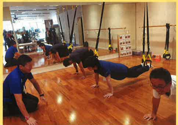
当院の医師もチャレンジしました！