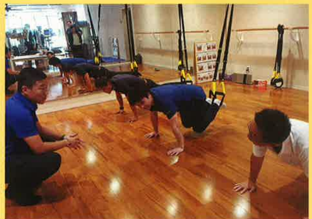
メディカルフィットネスのトレーニング風景