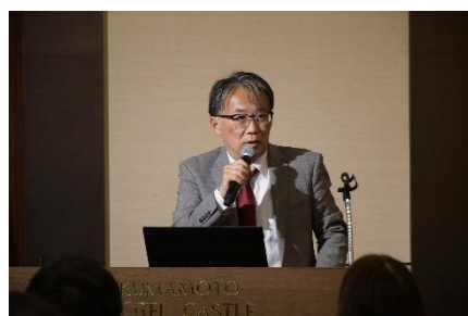
上菌診療部長 BSC発表