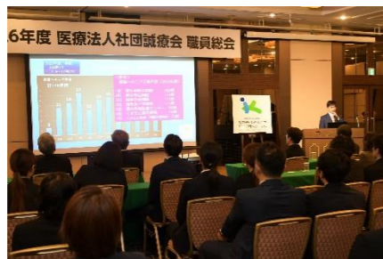
菊竹院長 実績報告