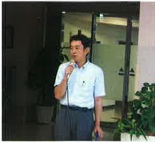
司会も頑張りました

8月11日（火）当院の名物行事となったカラオケ大会（今回で136回目となりました）が行われました。