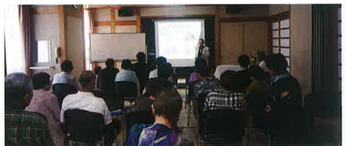
政圀会長の講演会