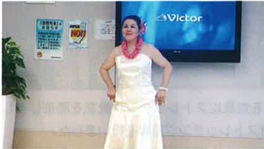
当院スタッフによるフラダンス

また夏休み期間中ということもあり、子どもたちのために“くまモンくじ引き大会”も同時に行われとても楽しいイベントとなりました。