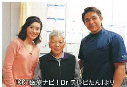
「KKK医療ナビ! Dr.テレビたん」より