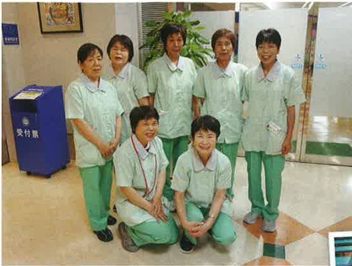
皆さんが快適に過ごせる様7人で頑張っています。