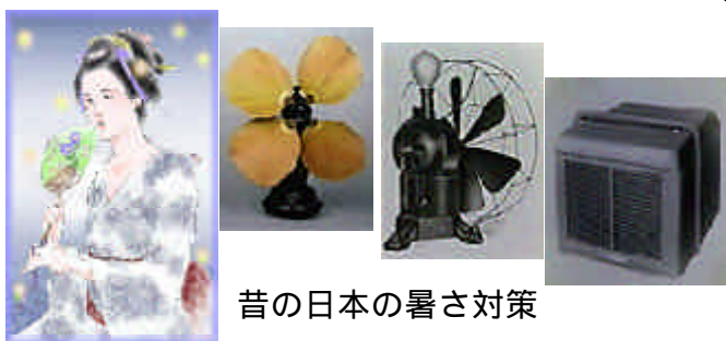
昔の日本の暑さ対策